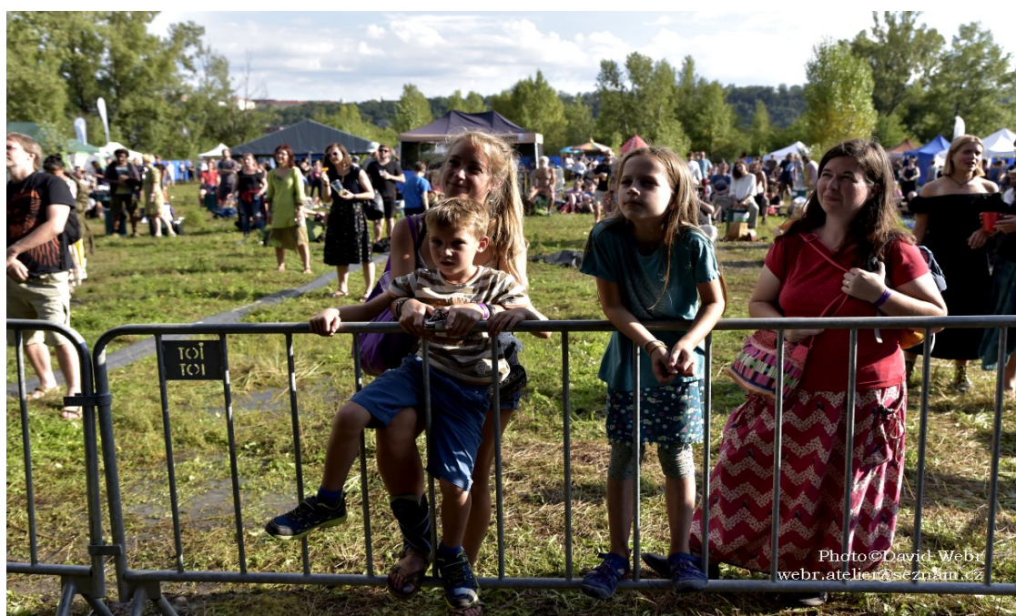
Respect Festival 2020