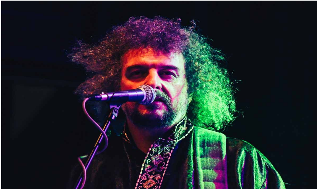
Baba Zula / koncert v Paláci Akropolis