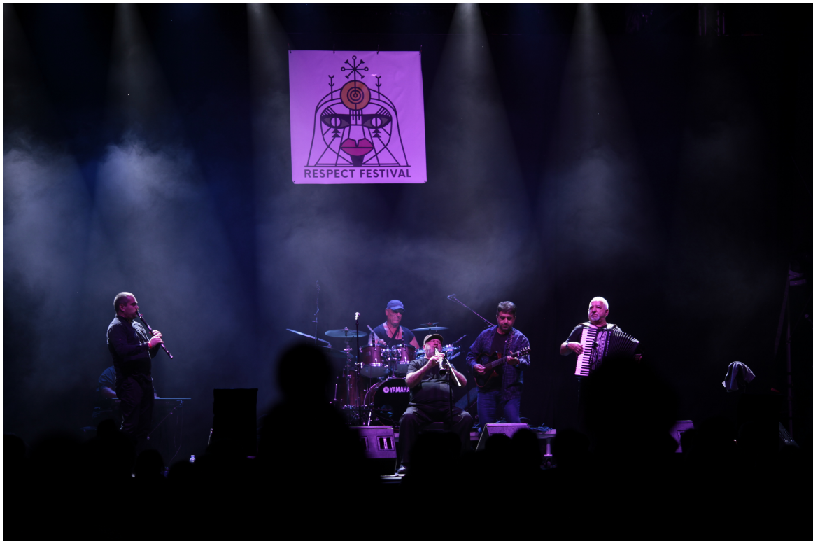
Respect Festival 2020 / Ivo Papisov & His Wedding Band