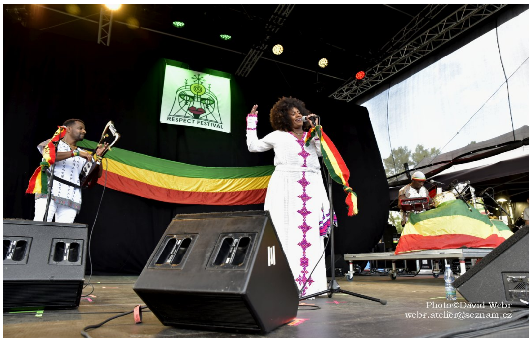
Respect Festival 2020 / Krar Collective